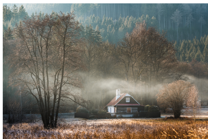
1. polovina října 2022 / Galerie u Sychry