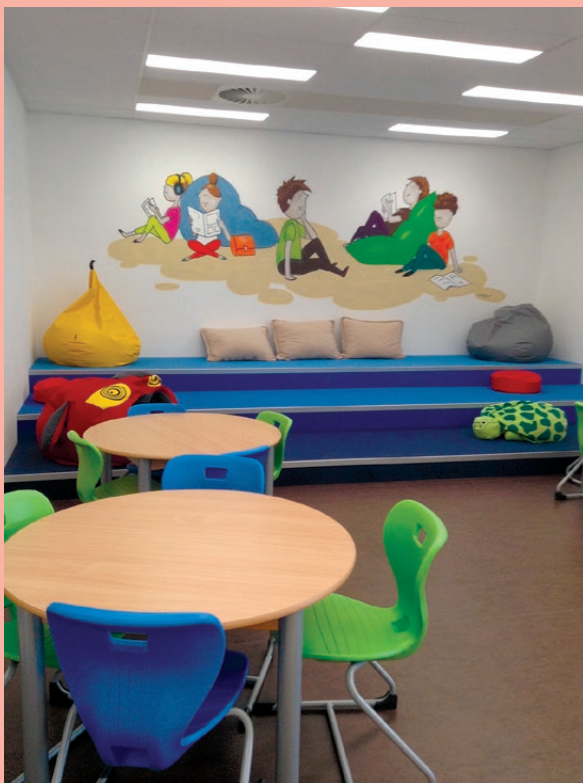
MěK Valašské Meziříčí