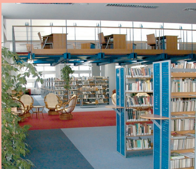
KK Karlovy Vary

(Směrnice IFLA: Služby veřejných knihoven, článek 12)