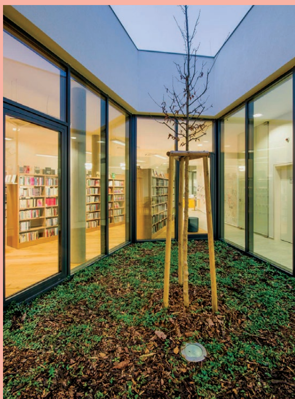
MK Ostrožská Nová Ves

Knihovna nabízí studijní místa 13 pro dospělé, děti a mládež, kde mohou uživatelé pracovat s knihovními dokumenty a informačními zdroji, a to individuálně nebo ve skupině. Tam, kde to místní podmínky umožní, je vhodné vytvářet čítárny, individuální a týmové studovny a místa pro soustředěné studium.