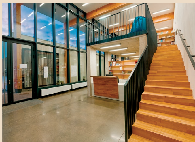
ObK Bílovice nad Svitavou